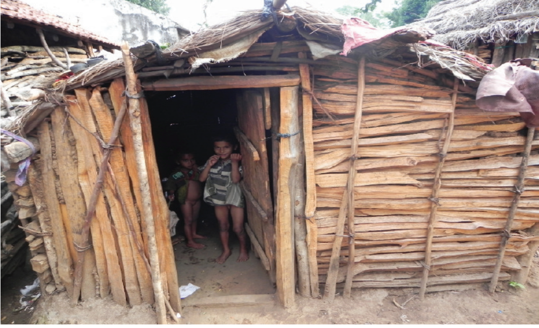
ಗಿರಿಜನರ ಜೋಪಡಿ ಮನೆ, ಬಿಳಿಗಿರಿ ರಂಗನ ಬೆಟ್ಟ