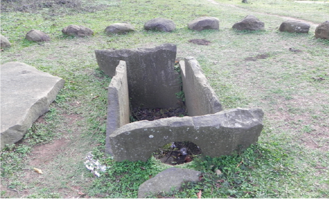
ಶಿಲಾಯುಗದ ಸಮಾಧಿ, ಬಿಳಿಗಿರಿರಂಗನ ಬೆಟ್ಟ