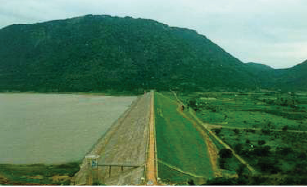
ಗುಂಡಾಲ ಜಲಾಶಯ, ಕೊಳ್ಳೇಗಾಲ ತಾ||