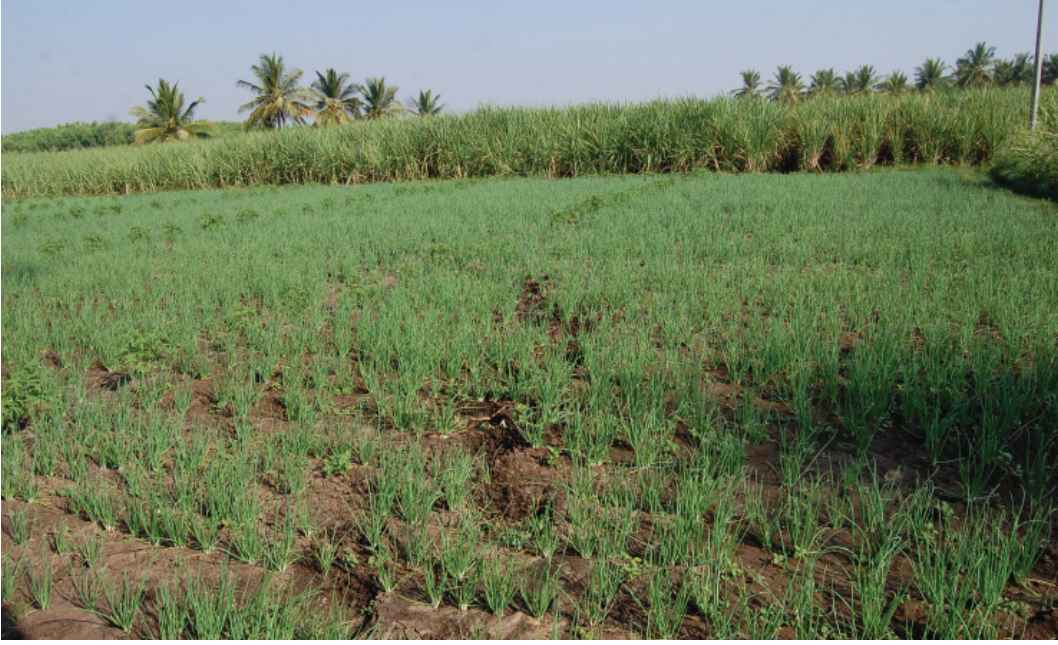
ಈರುಳ್ಳಿ ಮತ್ತು ಕಬ್ಬಿನ ಗದ್ದೆ, ಯಳಂದೂರು