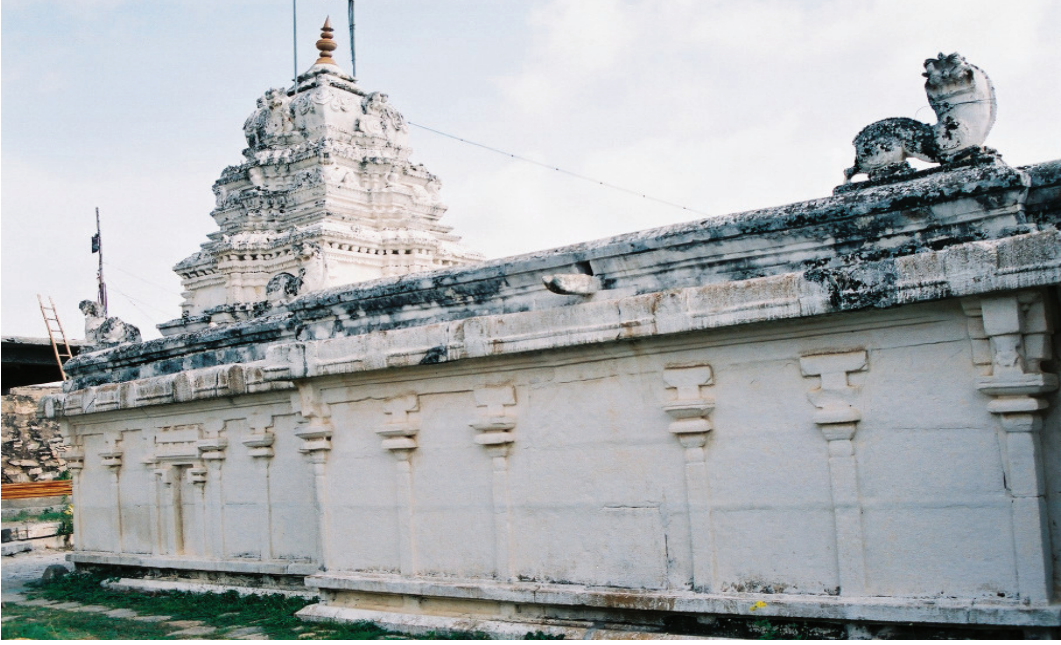
ವೀರಭದ್ರೇಶ್ವರ ದೇವಸ್ಥಾನ, ತೆರಕಣಾಂಬಿ