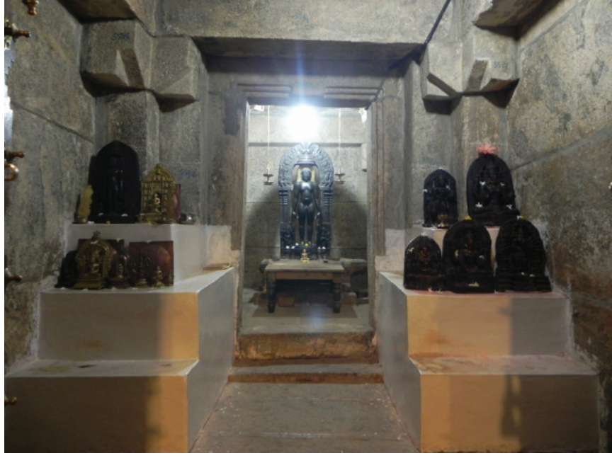
ಜೈನ ಬಸದಿ, ಉಮ್ಮತ್ತೂರು