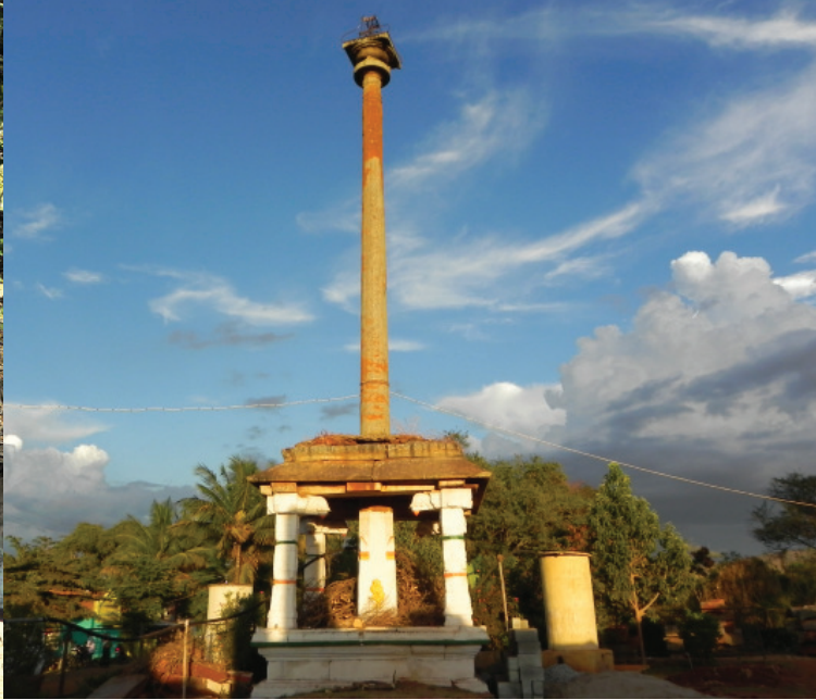
ತ್ರಯಂಬಕೇಶ್ವರ ದೇವಸ್ಥಾನ, ತ್ರಯಂಬಕಪುರ