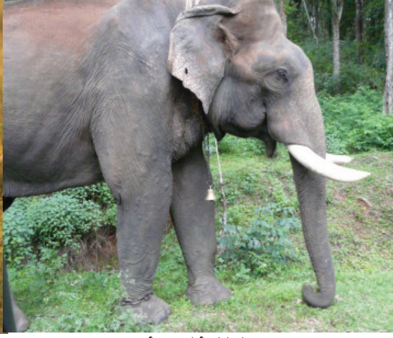
ಆನೆ, ಕ್ಯಾತದೇವರ ಗುಡಿ,