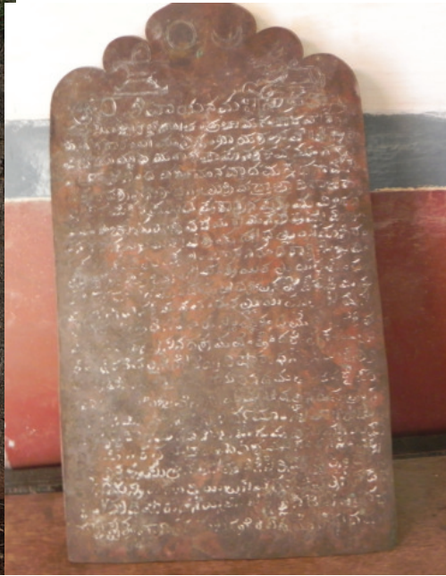
ಕಾರೇಪುರ ಮಠದ ತಾಮ್ರ ಶಾಸನ,