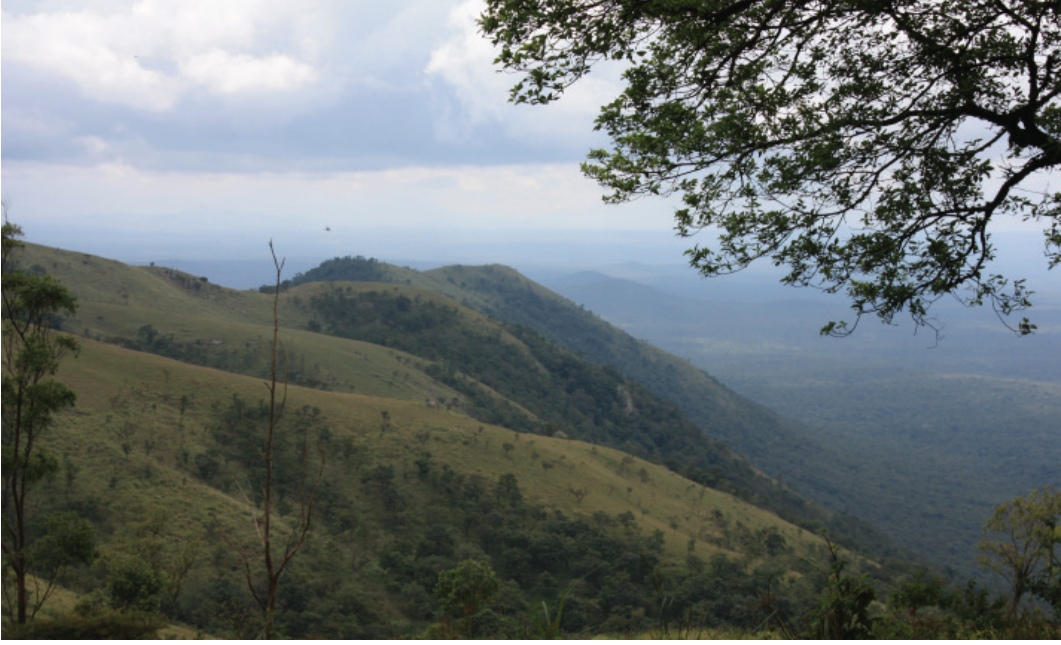
ಹಿಮವದ್ ಗೋಪಾಲಸ್ವಾಮಿ ಬೆಟ್ಟ