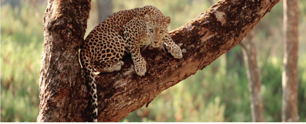
ಚಿರತೆ, ಕ್ಯಾತದೇವರ ಗುಡಿ