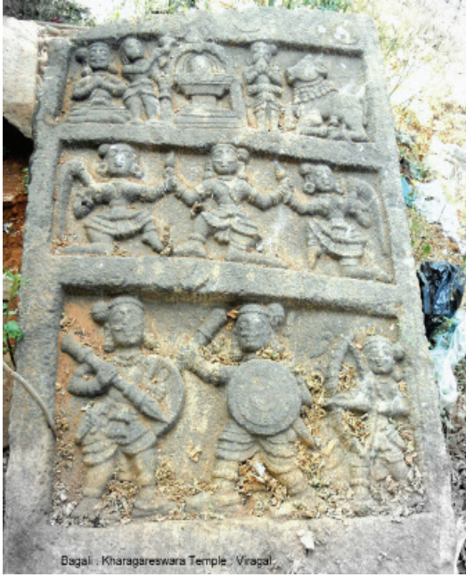
Bagali : Kharagāreswara Temple - Vrajal