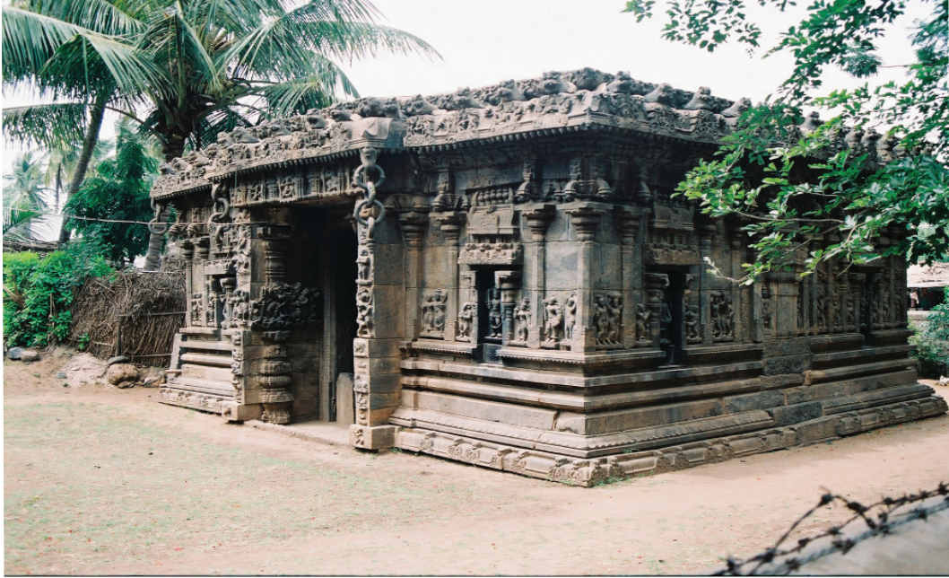
ಬಳೆ ಮಂಟಪ, ಗೌರಿಶಂಕರ ದೇವಸ್ಥಾನದ ದ್ವಾರಮಂಟಪ, ಯಳಂದೂರು