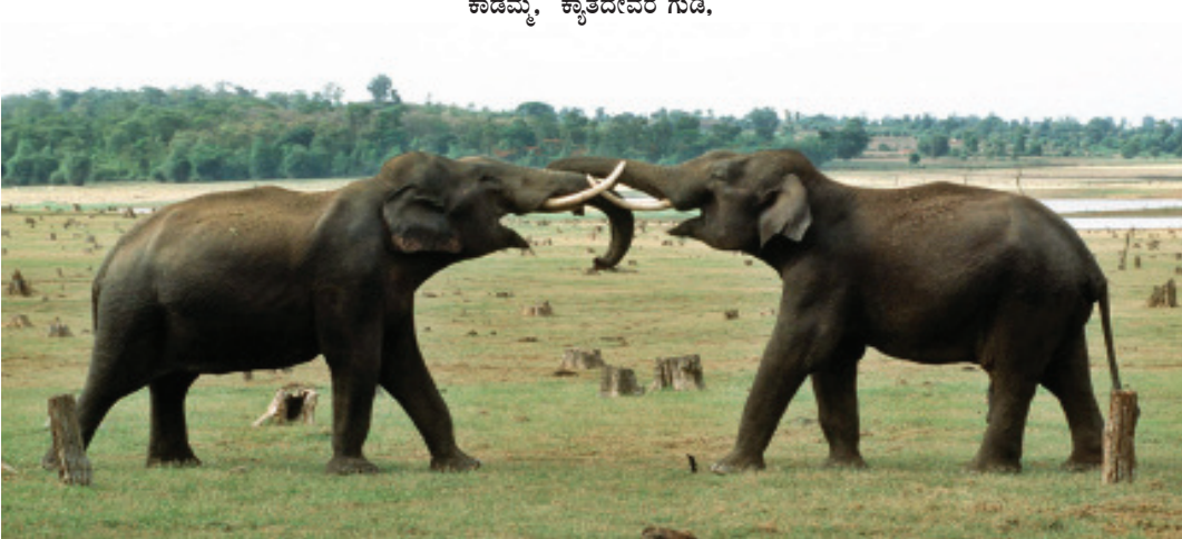
ಮದಗಜಗಳ ಕಾಳಗ, ಕಬಿನಿ ನದಿದಂಡೆ