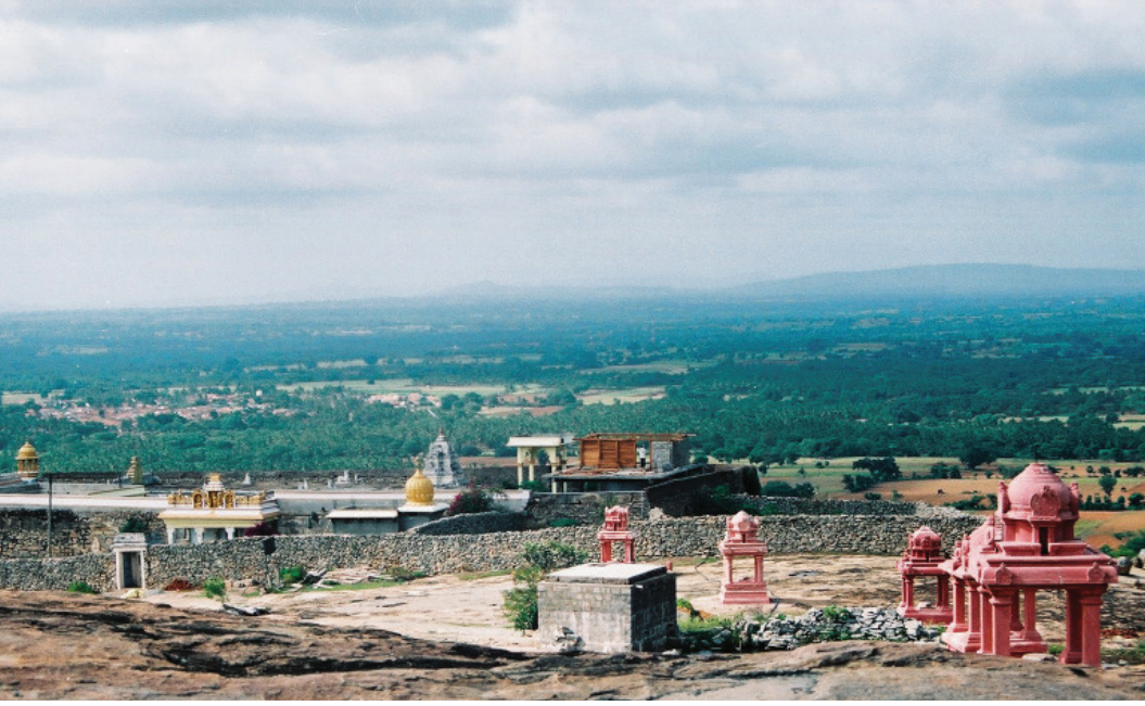
ಜೈನ ಸ್ಮಾರಕಗಳು, ಕನಕಗಿರಿ