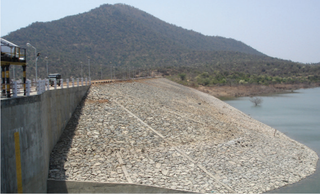
ಉಡುಪಿ ಹಳ್ಳಿ ಜಲಾಶಯ, ಅಂಬಿಕಾಪುರದ ಹತ್ತಿರ, ಕೊಳ್ಳೇಗಾಲ ತಾ||