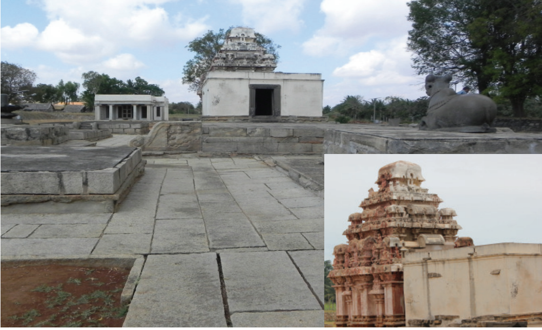
ರಾಮೇಶ್ವರ ದೇವಸ್ಥಾನ (ಸುಮಾರು ೯ನೇ ಶತಮಾನ) ನರಸಮಂಗಲ