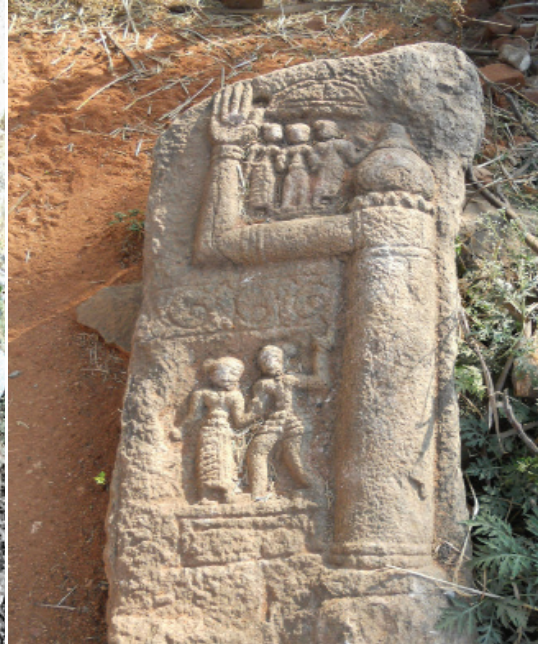
ಸತಿ ಕಲ್ಲು, ಬಾಗಲಿ