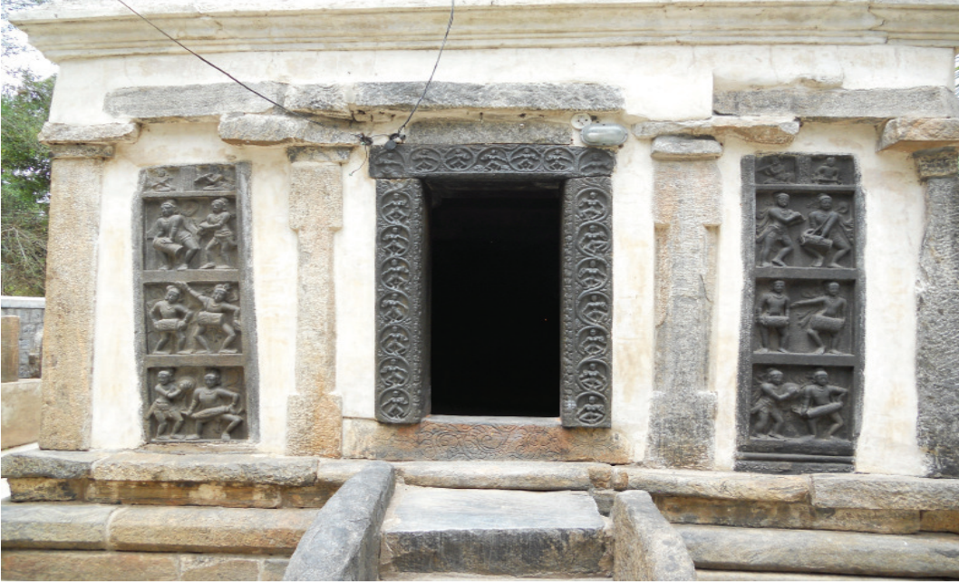
ಆಕರ್ಷಕ ದ್ವಾರಬಂಧ, ಅರ್ಕೇಶ್ವರ ಗುಡಿ, ಹಳೆ ಆಲೂರು