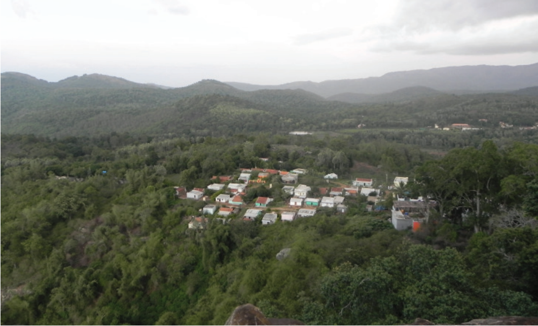
ಬಳಗಿರಂಗನ ಬೆಟ್ಟದ ವಿಹಂಗಮ ನೋಟ