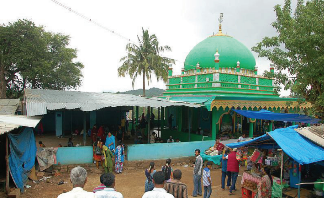
ದರ್ಗಾ, ಶಿವನಸಮುದ್ರ, ಕೊಳ್ಳೇಗಾಲ ತಾಲೂಕು