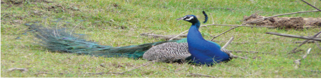
ನವಿಲು. ಕ್ಯಾತದೇವರ ಗುಡಿ,