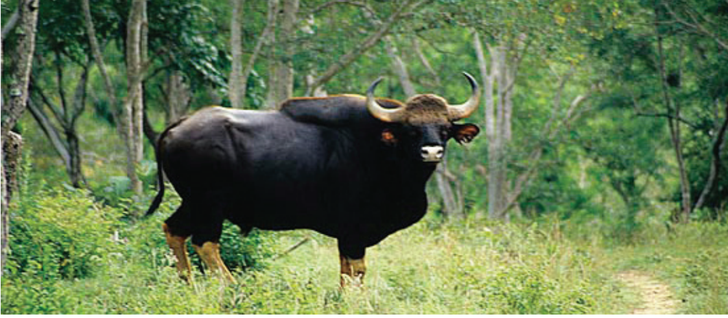
ಕಾಡಮ್ಮೆ, ಕ್ಯಾತದೇವರ ಗುಡಿ,