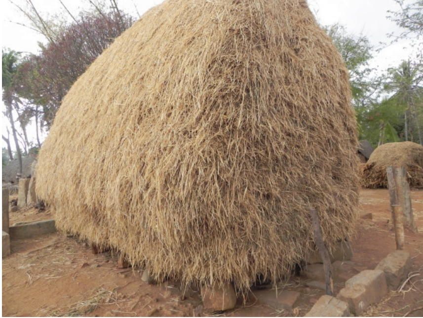
ಹುಲ್ಲಿನ ಬಣವೆ, ಉಮ್ಮತೂರು