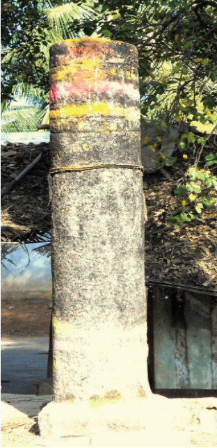
ಬಿಸಿಲ ಮಾರಮ್ಮ, ಬಾಗಲಿ