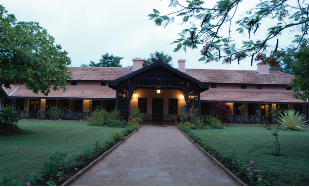
ಕಬಿನಿ ರಿವರ್ ಲಾಡ್ಜ್