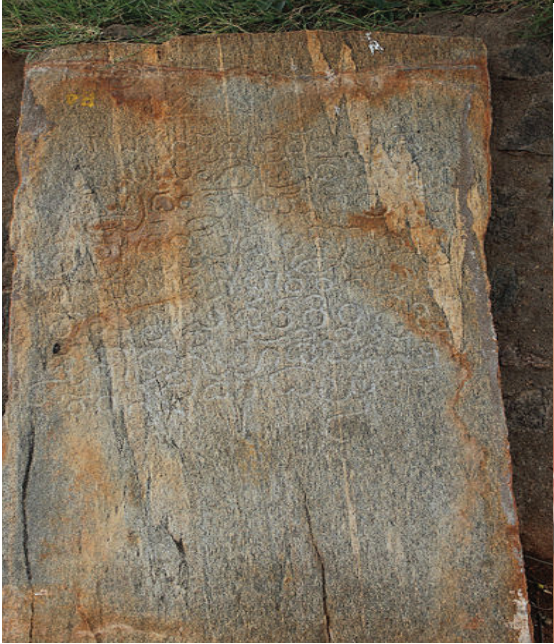
ಶಿಲಾ ಶಾಸನ ರಾಮೇಶ್ವರ ದೇವಾಲಯ, ನರಸಮಂಗಲ