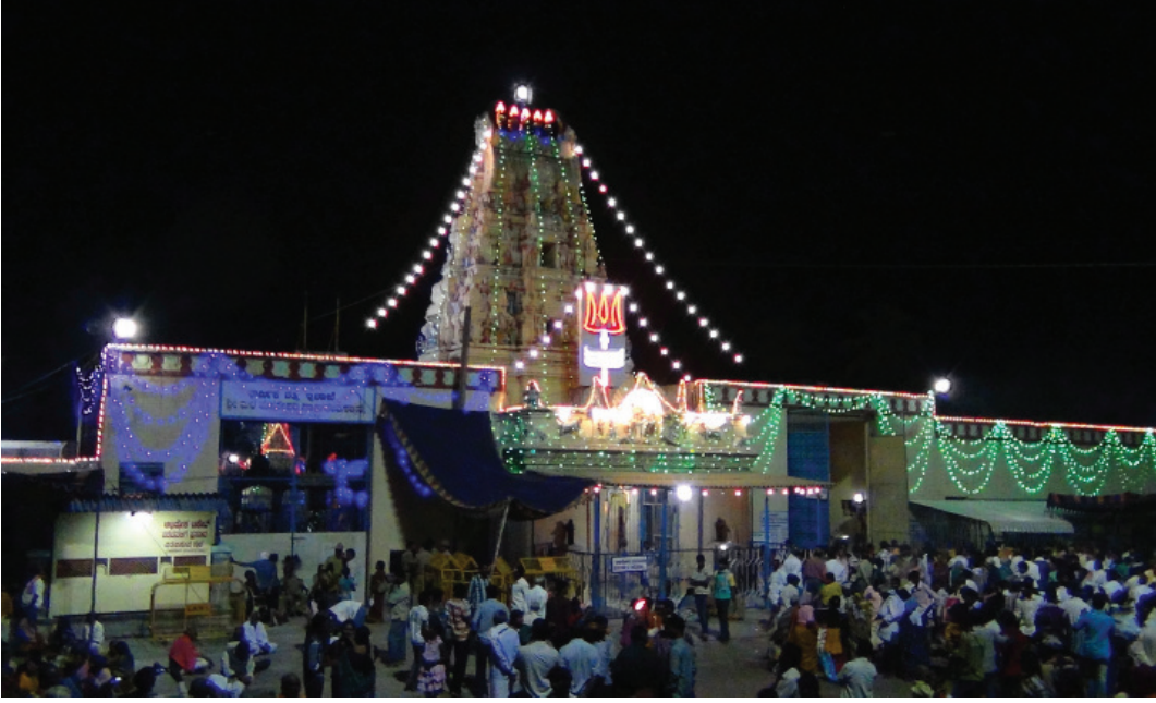
ಮಲೆಮಹದೇಶ್ವರ ದೇವಸ್ಥಾನದ ರಾತ್ರಿ ನೋಟ