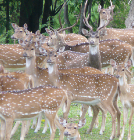
ಸಾರಂಗಗಳ ಹಿಂಡು, ಬಂಡಿಪುರ