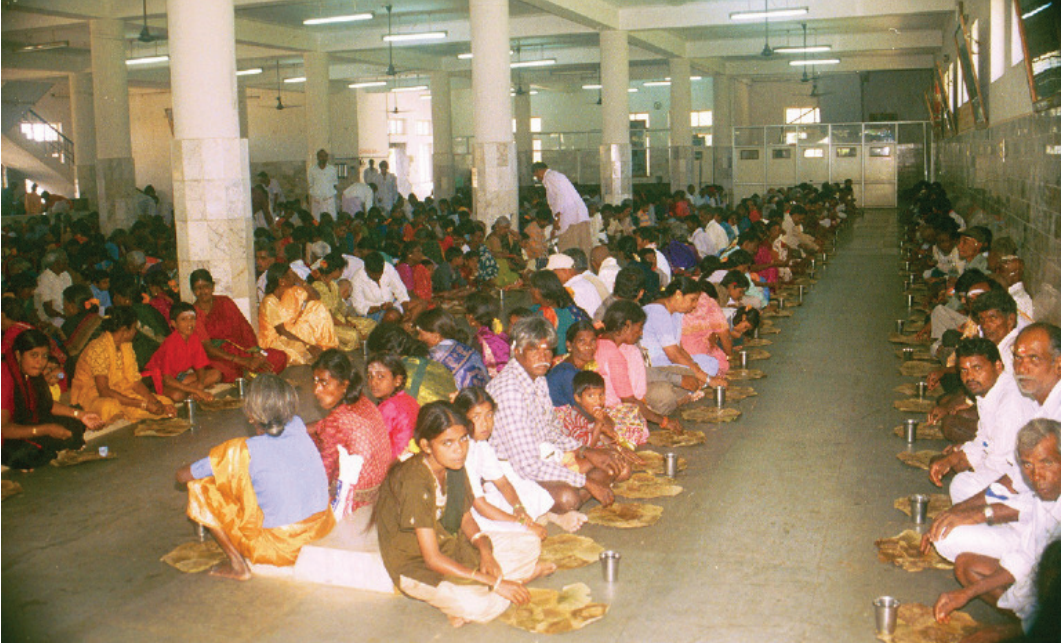
ದಾಸೋಹ ಮಂದಿರ, ಮಲೆ ಮಹದೇಶ್ವರ ದೇವಸ್ಥಾನ, ಮಲೆಮಹದೇಶ್ವರ ಬೆಟ್ಟ